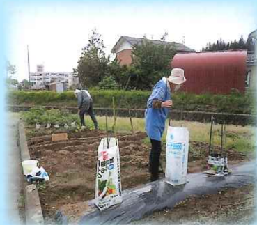
畑の季節になりました

きれいなクジャクサボテンの花が咲きました。3階ケアハウスには色々な花や観葉植物が季節を感じさせてくれます。また施設内にある中庭の草取りや整備をケアハウスのご利用者がしてくださいます。