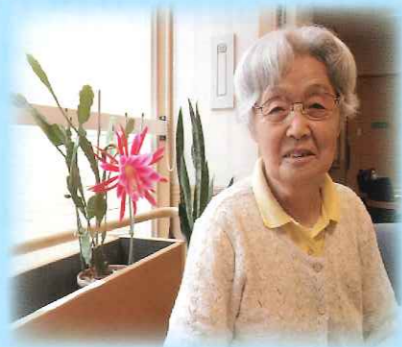
クジャクサボテンと