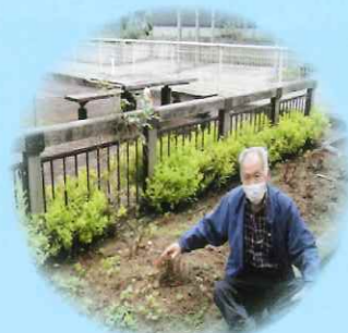
草取りに精が出ます