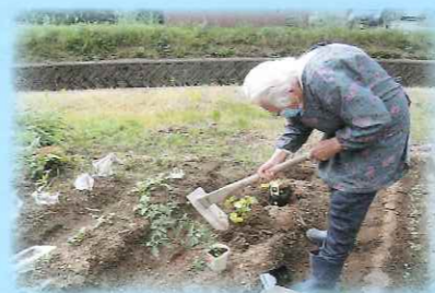
今から収穫が楽しみです