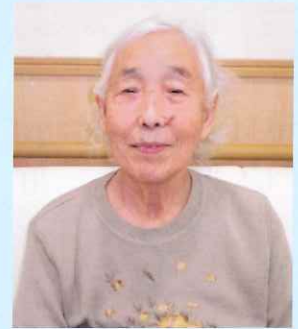
題字:土田 ヤス様 特別養護老人ホーム 古志乃里