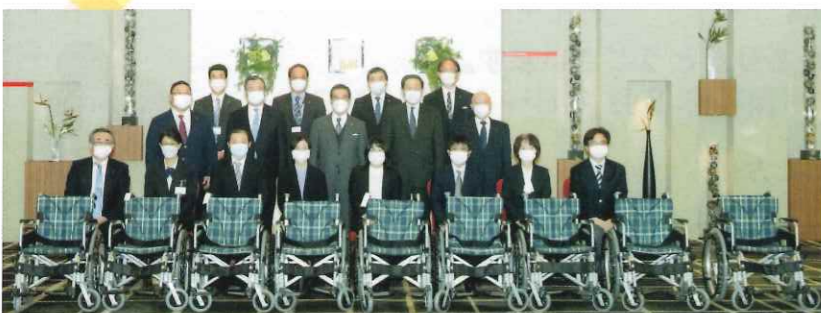
令和4年度 アークベルチャリティ基金 車椅子贈呈式 令和4年12月15日 於 長岡ベルナール