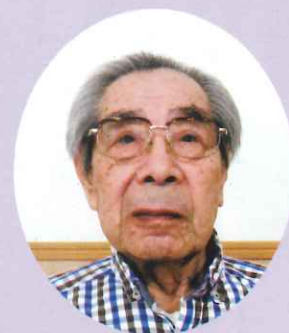
題字: 若杉 博 様 古志乃里