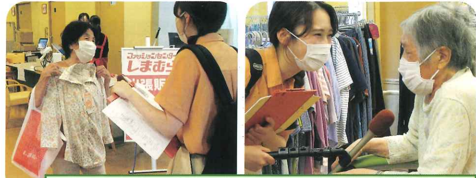
NST新潟総合テレビより、インタビューを受けられました。

ファッションセンターしまむら様より、出張販売をしていただき、ご利用者・ご家族でお買い物を楽しんでいただきました。