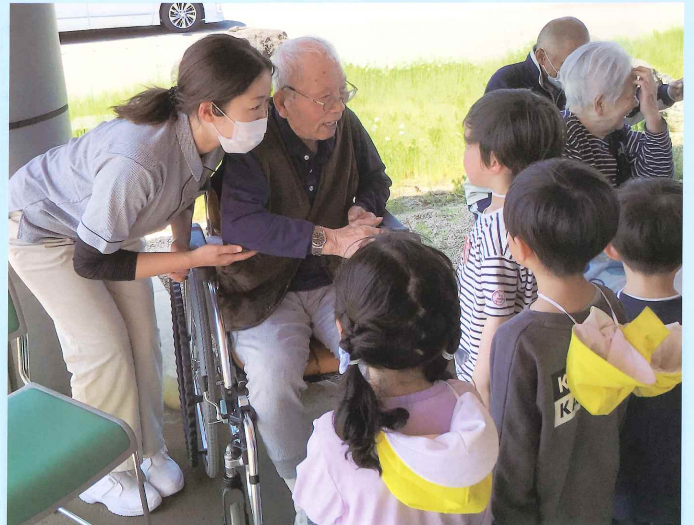
どろんこ保育園の園児がお散歩をしながら遊びにきてくれました♪