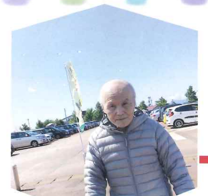
関光二郎様によるイラスト